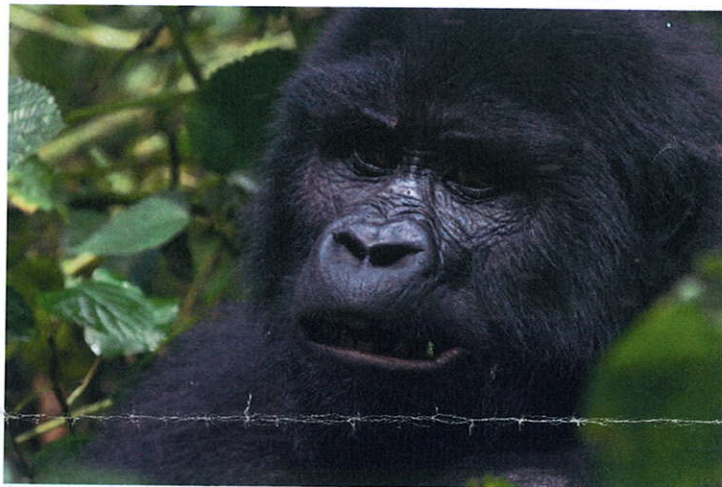
Gorilla im Bwindi Impenetrable National Park

Das bringt uns auf die Frage, wie es mit den in der Schweiz lebenden Ausländern steht. Inwieweit ist es sinnvoll, von ihnen Integration zu fordern und was müsste man darunter verstehen?