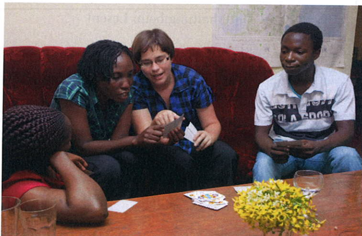
Jassen: Ein Stück Schweizer Kultur in Tansania